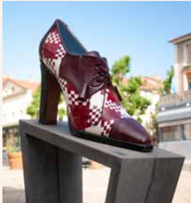
Derby tressé Stéphane Kélian • 1990

Inspirées de modèles existant au musée de la chaussure, les 12 chaussures monumentales de 2 mètres de haut déterminent un parcours au coeur du centre-ville de Romans. Ces modèles emblématiques et remarquables ont été créés par des fabricants locaux et de célèbres bottiers. Ce parcours ludique permet d'être guidé jusqu'au musée de la chaussure. Jean-Luc Tamisier et Sylvie Favel sont à l'origine de cette scénographie urbaine et du design des socles.