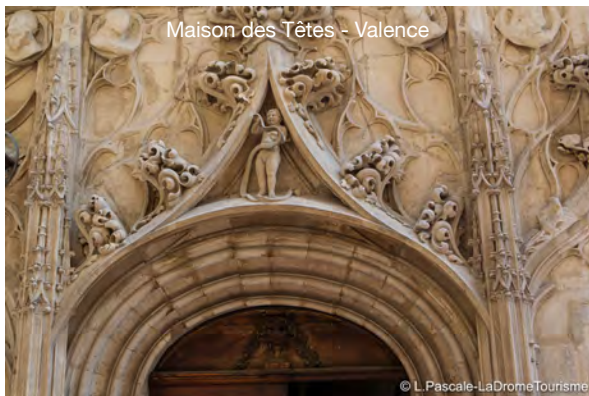
Maison des Têtes - Valence