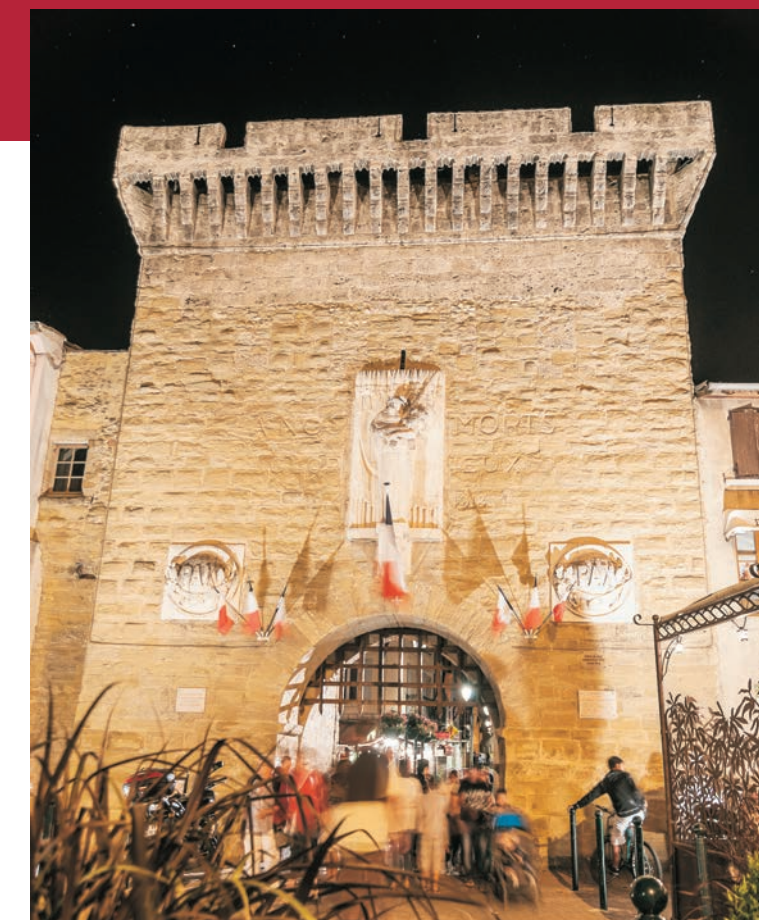
Plan du centre ville

valencetourisme.com OFFICE DE TOURISME ET DES CONGRÈS COMMUNAUTÉ D'AGGLOMÉRATION VALENCE ROMANS SUD RHÔNE-ALPES